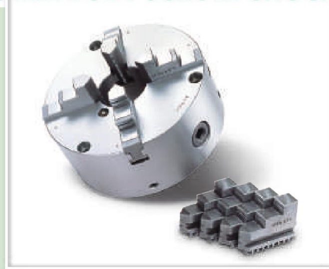
規格表 » Specifications